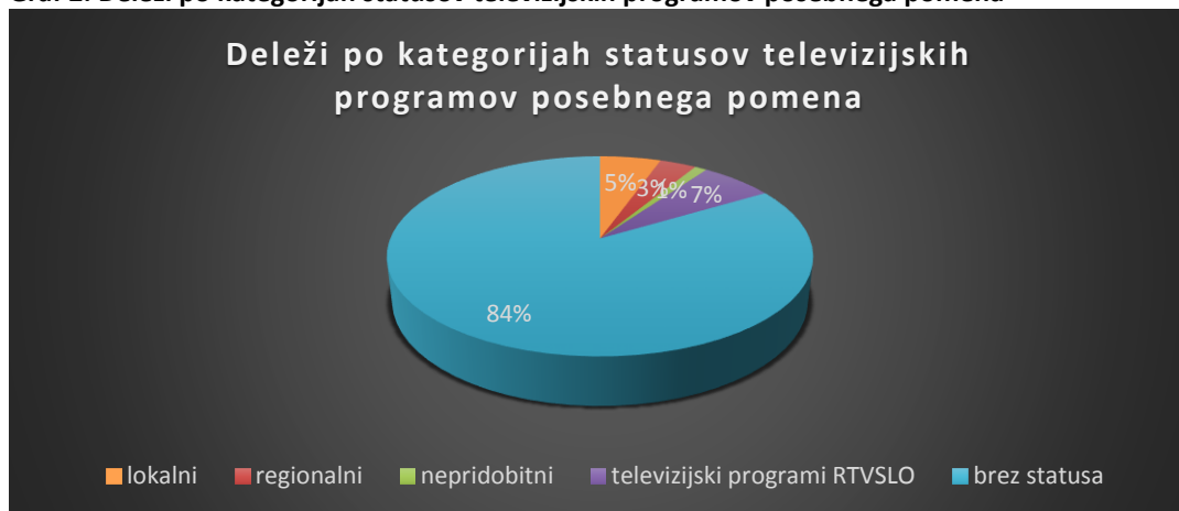
Graf 2: Deleži po kategorijah statusov televizijskih programov posebnega pomena